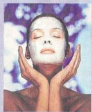
Seduta di yoga in terrazza al Club Conti e maschera di bellezza