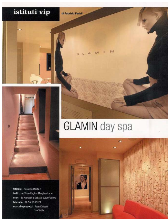
L'articolo da pp. 184 a pp. 187