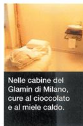
Nelle cabine del Glamin di Milano, cure al cioccolato e al miele caldo.

Glamin Day Spa, viale Regina Margherita 4 (Milano). Tel. 02.54167921; www.glamin.it